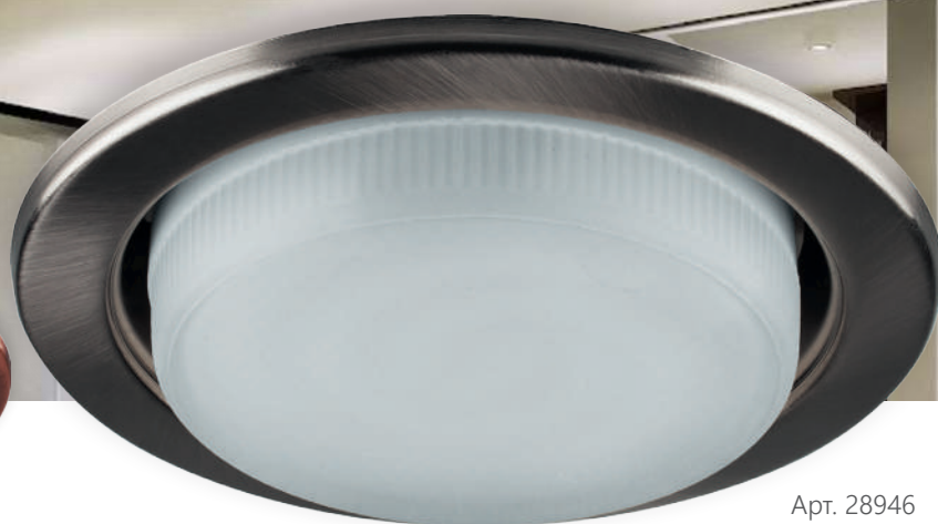
Арт. 28946 титан