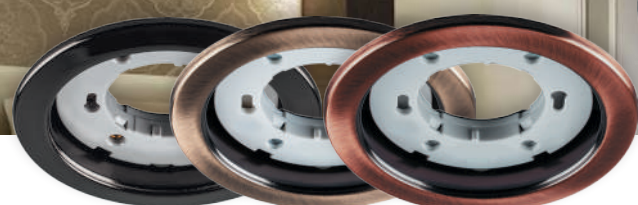
Арт. 28947 черный хром